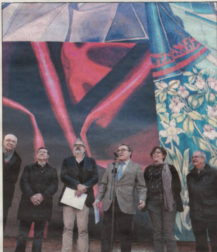
Imagen del estreno del mural en el Casç Antic

LA ACTIVIDAD GRIPAL en Catalunya ha iniciado su descenso, aunque todavía se mantiene en niveles moderados y altos, según el Pla d'Informació de les Infeccions Respiratòries Agudes a Catalunya. Así, durante la semana del 7 al 13 de marzo la tasa de síndromes gripales se situó en los 313 casos por 100.000 habitantes, habiendo alcanzado la semana anterior el pico epidémico de la gripe para esta temporada con 358,8 casos. La incidencia ha bajado, especialmente, entre los menores.