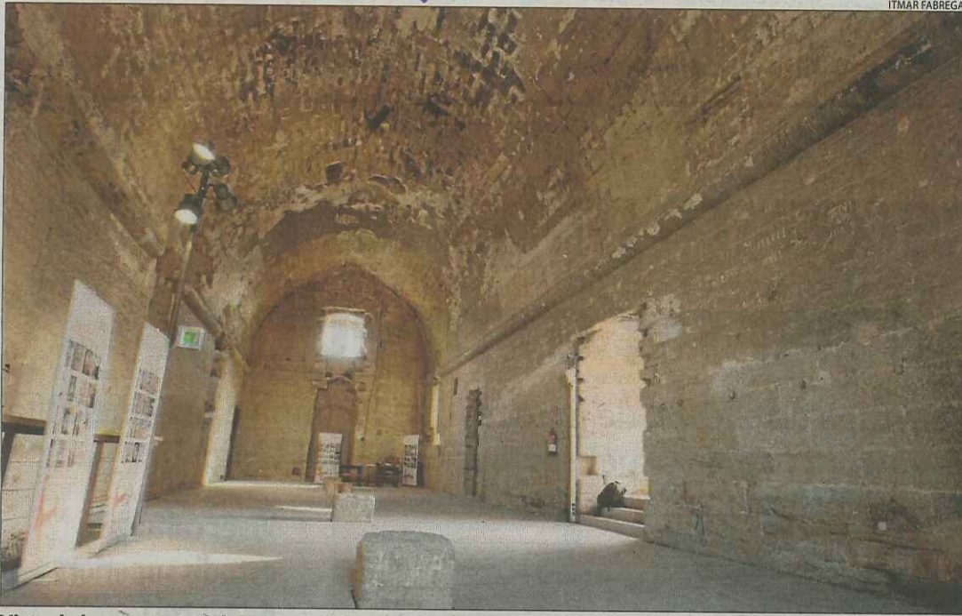
Vista de la nau central del castell dels Templers, que ha quedat neta de grafitis.